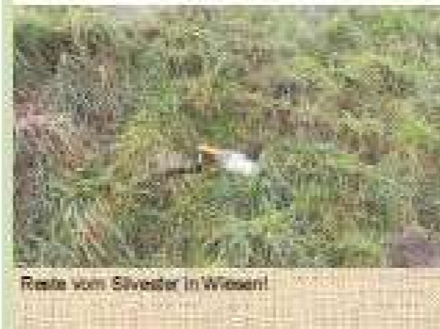
Reste vom Silvester in Wasser!