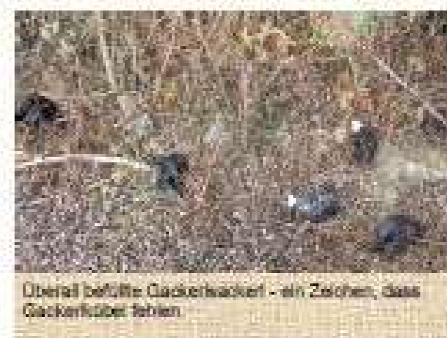
Überall befüllte Gackerkubel - ein Zeichen, dass Gackerkubel fehlen