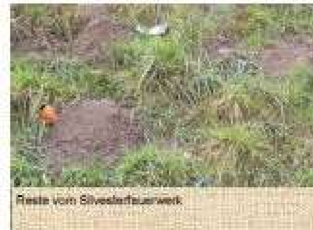
Reste vom Silvesterfeuerwerk

Unsere Badesiedlung ist einzigartig, und soll es auch bleiben. Bitte, helfen Sie mit. Durch unsere Interessengemeinschaft IGM Dschungeldorf wird Ihr Müll im Sommer wöchentlich abgeholt.