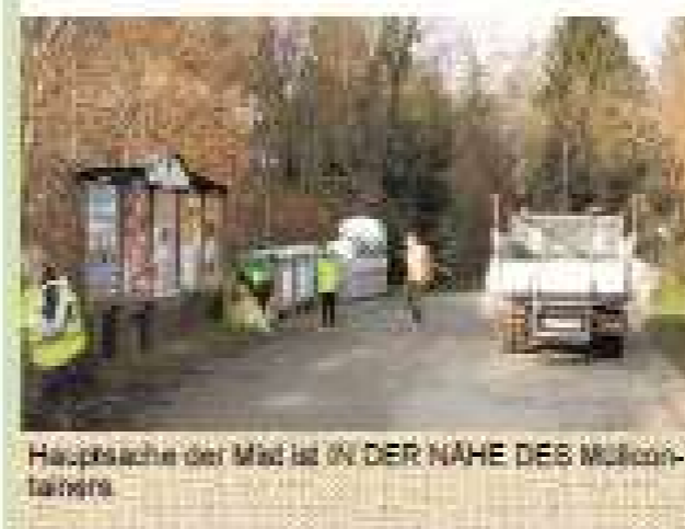
Hauptsache der Müll ist IN DER NAHE DES Müllcontainers.