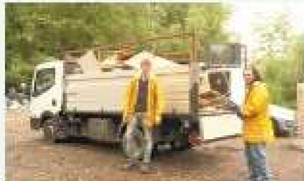
4 Wochen Hochwasserinsatz 2013

Ab Samstag, den 12.4.2014 können Sie Ihre Gemeindefürsöke, Jubesöke, den IGM Servicepass, IGM-Plakette, Bündelanhänger, und vieles mehr im IGM Clubhaus abholen.